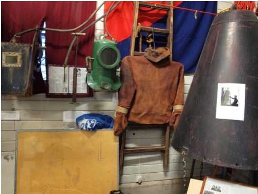
SDHS:n Dyktankhus, paikka josta SSHY tavallaan alkoi!!!!

Kaksi tapahtumaa. Mikä on se kolmas? Ruotsin Sukellushistoriallinen Seura, Svenska Dykerihistoriska Sällskapet juhlii Tukholmassa 40 – vuotista toimintaansa 24.- 26.5. Tätä tapahtumaa ei voi välttää! Tästä syystä Sukelluksen Päivä ei ole Jokisataman avajaisviikonloppuna, vaan helatorstaina.