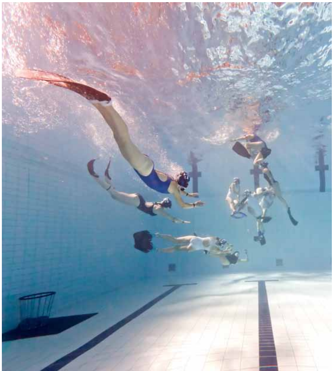
MM-kilpailut 2011 pelattiin Helsingissä.