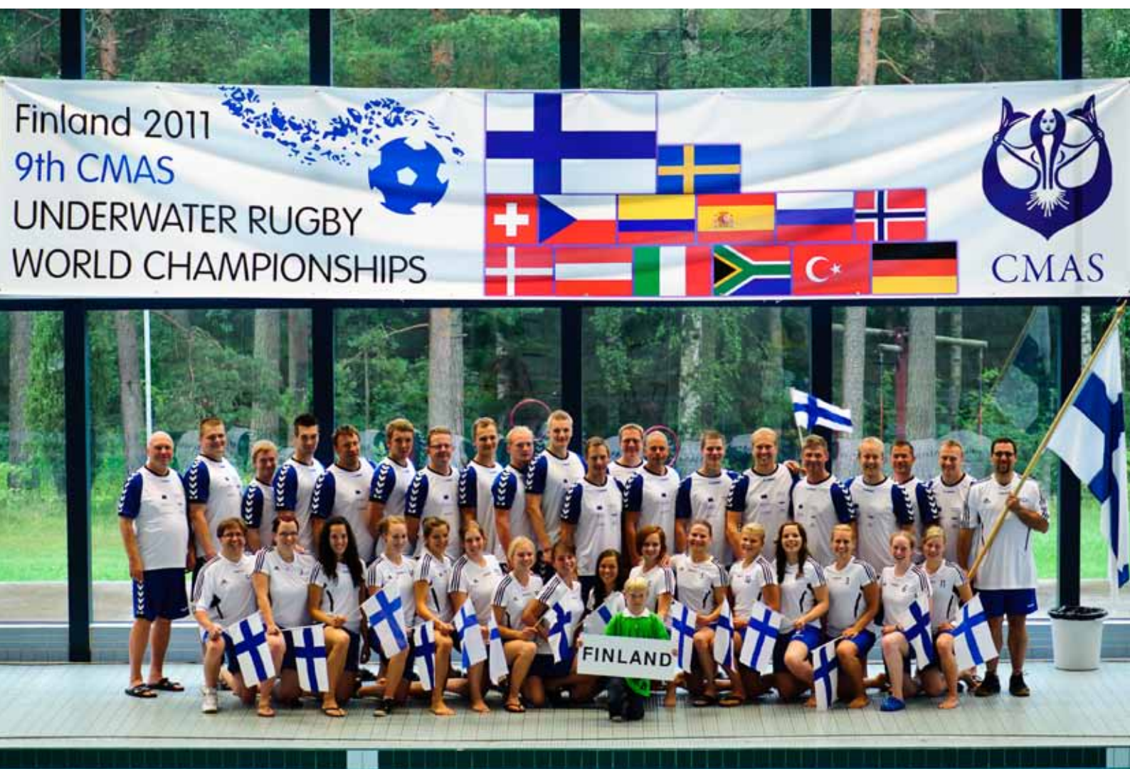
Uppopallon MM-joukkue 2011.