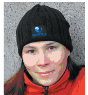
HUSKY:n villapipo fleeevuorilla 22,- euroa