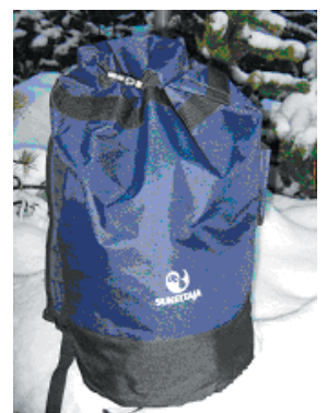
Merimiessäkki-tyylinen uimahalli/vapaa-ajan reppu 15,- euroa