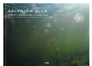
Aaltojen alla - Itämeren vedenalaisen luonnon opas 28,- euroa